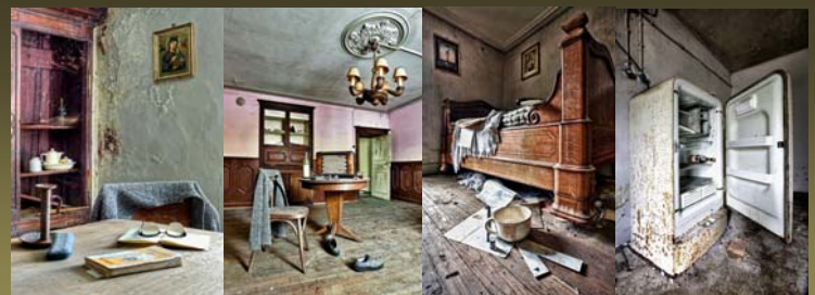
LA SÉRIE DE GENNARO TADDEI « PRÉSENCE SUGGÉRÉE D'ALOÏSE »