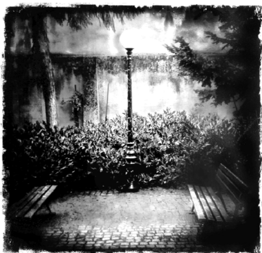
Victor Coucosh « Le Coin carré »