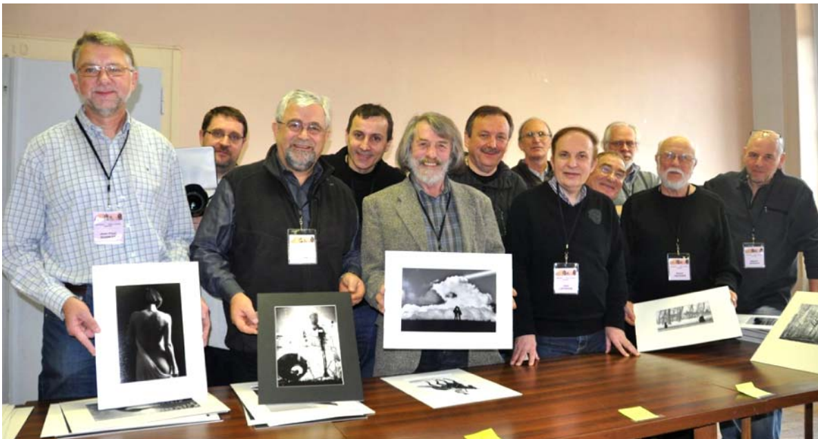
Le jury, les commissaires et les organisateurs du Concours National 1 noir et blanc

N'hésitez pas à me communiquer remarques, suggestions ou modification de la liste d'envoi