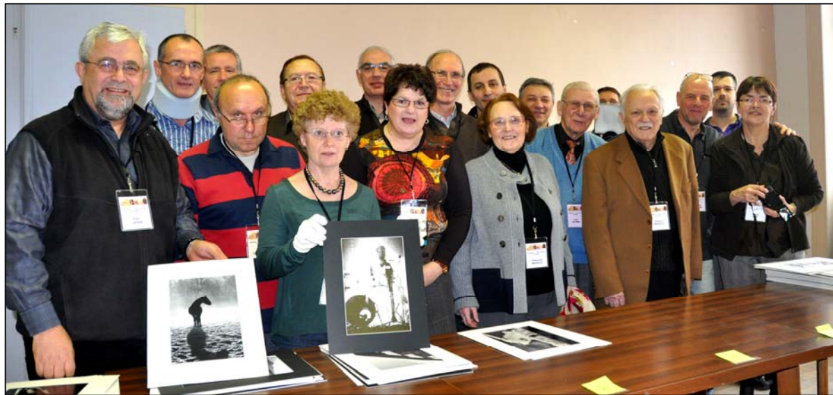
Tous les membres du Gape ayant participé à la réussite de cette journée.